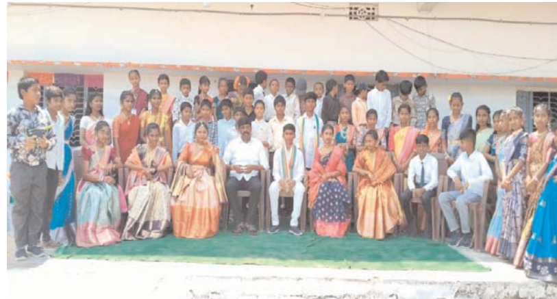
సకిరేకల్ పట్టణం :-