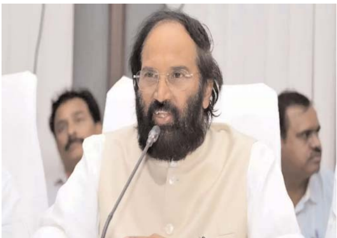
హైదరాబాద్, అన్వేషణ ప్రతినిధి

తెలంగాణ రాష్ట్రంలో గ్యాస్ సిలిండర్ల కొరత లేదని మంత్రి ఉత్తమ్ కుమార్ రెడ్డి స్పష్టం చేశారు. గ్యాస్ గృహ వినియోగదారులు గందరగోళానికి గురికాకుండా కలెక్టర్లు చర్యలు తీసుకోవాలని దిశానిర్దేశం చేశారు. గృహ వినియోగదారులకు సరిపడా గ్యాస్ సరఫరా చేస్తామని తెలిపారు. ఏ ఒక్కరూ ఆందోళన చెందాల్సిన పని లేదని పేర్కొన్నారు. గ్యాస్ కొరతపై మంత్రి ఉత్తమ్ కుమార్ రెడ్డి