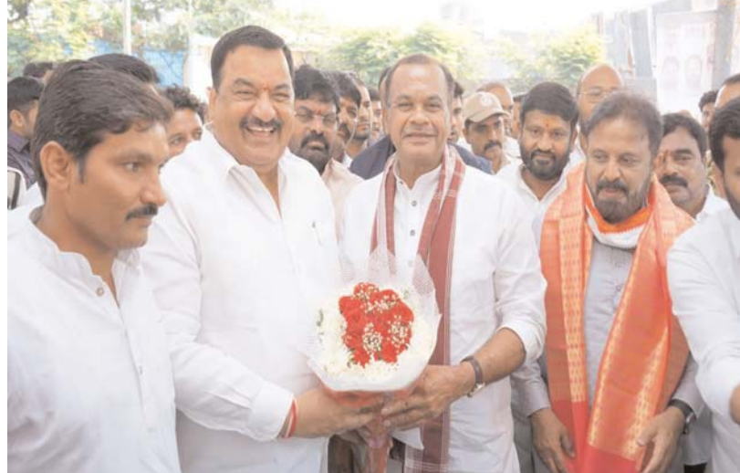
హయత్ నగర్ :-అన్నేషనేత్రం ప్రతినిధి

హయత్ నగర్ సాయిబాబా బెంపుల్ (తొర్రూర్ ఎక్స్ రోడ్) నుండి జీ సూల్ వరకు సుమారు రూ.10 కోట్ల అంచనా వ్యయంతో 2 లేన్ రహదారిని 4 లేన్ రహదారిగా అభివృద్ధి చేసే పనులకు రాష్ట్ర రోడ్డుదభవనాలు,సినిమాటోగ్రఫీ శాఖ మంత్రి శ్రీ కోమటిరెడ్డి వెంకట్ రెడ్డి గారు శంకుస్థాపన చేశారు..ఈ రహదారి విస్తరణతో ప్రాంతీయ రవాణా సౌకర్యాలు మెరుగుపడి,ట్రాఫిక్ రద్దీ తగ్గడంతో పాటు ప్రజలకు సురక్షితమైన మరియు వేగవంతమైన ప్రయాణ సౌలభ్యం కలగనుంది..నగర అభివృద్ధికి అనుగుణంగా మౌలిక వసతులను బలోపేతం చేయడంలో ప్రభుత్వం కట్టుబడి ఉందని మంత్రి తెలిపారు..