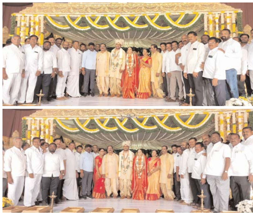
హైదరాబాద్ :-అన్నేషనేత్రం ప్రతినిధి