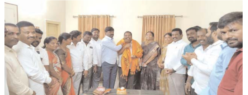
నకిరేకల్ నియోజకవర్గం :- అన్నేషనేత్రం ప్రతినిధి

చిట్టాల మున్సిపాలిటీ చైర్మన్ పందిరి గీత గారి భర్త పందిరి రమేష్ గారి జన్మదినం సందర్భంగా శాలువాతో సత్కరించి కేకు కట్ చేసి శుభాకాంక్షలు తెలియజేసిన గౌరవ ఎమ్మెల్యే శ్రీ వేముల వీరేశం గారుకు సందర్భంగా రమేష్ గారు ఆయురారోగ్యాలతో, దీర్ఘాయుష్యతో ప్రజలకు మరింత సేవ చేయాలని ఆకాంక్షిస్తూ ఎమ్మెల్యే గారు హృదయపూర్వక శుభాకాంక్షలు తెలిపారు.