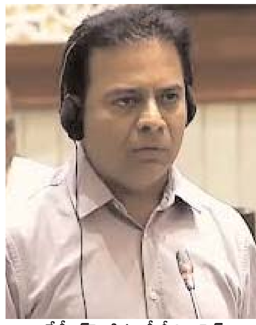
కేటీఆర్ పై డిమాండ్ సీఎం ఫైర్

కేటీఆర్ వ్యాఖ్యలకు మంత్రి కోమటిరెడ్డి వెంకటరెడ్డి కౌంటర్ ఇచ్చారు. కాంగ్రెస్ ప్రభుత్వానికి ధన్యవాదాలు చెప్పాలని అన్నారు. 'రేషన్ కార్డు ఇచ్చినందుకు ధన్యవాదాలు చెప్పాలి. యంగ్ ఇండియా స్కూల్ కట్టినందుకు, ఆర్టీసీలో మహిళలకు ఉచిత బస్సు ఇచ్చినందుకు, ఇందిరపల్లి ఇంట్ల ఇచ్చినందుకు ధన్యవాదాలు చెప్పాలి' అని అన్నారు. కేటీఆర్ ఓపికగా ఉండాలని మంత్రి హితవుపలికారు. ఈ ప్రభుత్వం పేదల కోసమే ఉందని స్పష్టం చేశారు. గత బీఆర్ఎస్ ప్రభుత్వం లక్షల కోట్లు అప్పు చేసిందని.. వాటికి తాము వడ్డీ కడుతున్నామని.. ఎందుకు ధన్యవాదాలు చెప్పాలంటూ కేటీఆర్ కు మంత్రి కోమటిరెడ్డి వెంకటరెడ్డి ఢిల్లైన జవాబిచ్చారు.