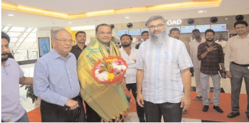
హైదరాబాద్:- అన్నేషనేత్రం ప్రతినిధి