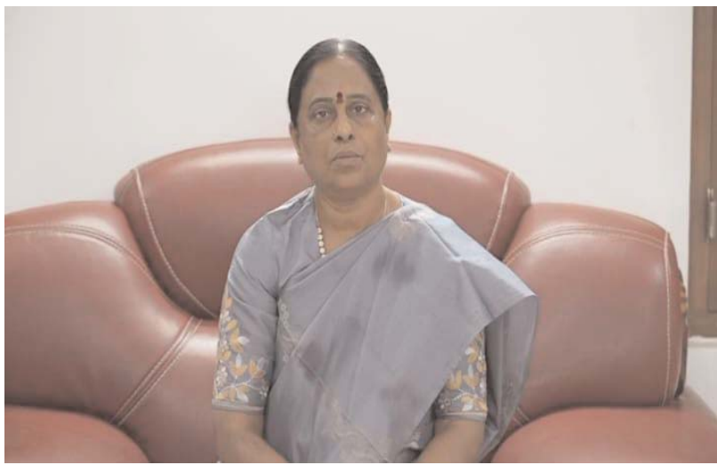
శ్రీమతి కొండా సురేఖ గారు ఉగాదిశుభాకాంక్షలు తెలిపారు..!!

శ్రీ పరభావ నామ సంవత్సరాన్ని సాంప్రదాయబద్ధంగా స్వాగతం పలుకుదామని మంత్రి పిలుపునిచ్చారు..!! చాలా రుచులతో తయారయ్యే ఉగాది పచ్చడిలో తీపి చేదు రుచులు ఉన్నట్లే జీవితంలో సుఖాలు కష్టాలు సహజమని మంత్రి పేర్కొన్నారు..!! కొత్త తెలుగు సంవత్సరంలో ప్రజలందరికీ శుభాలు కలగాలని, ప్రతి కుటుంబ సభ్యులతో సుఖంతో సుఖింపాలని ఉండాలని మంత్రి కొండా సురేఖ గారు ఆకాంక్షించారు..!!