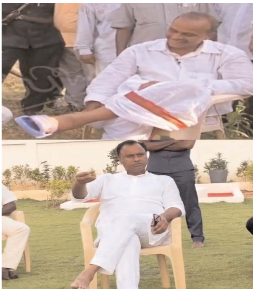
అప్పుడు ఆ రాజస్థాన్..ఇప్పుడు ఈ రాజస్థాన్..

అదే మార్గం.. అదే తీరు.. ఫోన్: 10:13 గ్రామీ, 3/18/2026 0 +శీత్రీప్రభు ఛానెల్ వంపు: లిమాట తప్పను..మడమ తిప్పను..అంటే మునుగోడు నియోజకవర్గ ప్రజలకు ఏదయితే అమీ ఇచ్చిందో తన సొంత డబ్బులు అభివృద్ధి చేయడమే కాకుండా ప్రతి ఇంటి గడప తల్లి కులాలకు మతాలకు అన్ని పద్ధాలకు నాయుం చేసి గొప్ప మనస్సున్న ప్రజా నాయకుడు ఎమ్మెల్యే రాజగోపాల్ రెడ్డి అదే ఆయన మార్గం..! అప్పుడు ఆ రాజస్థాన్..ఇప్పుడు ఈ రాజస్థాన్.. అదే మార్గం..అదే తీరు..