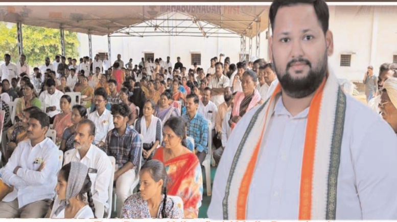
Team Devaran Naik // Social Media-Devarakonda

దేవరకొండ నియోజకవర్గ పరిధిలో రెండు సంవత్సరాలలో ముఖ్యమంత్రి సహాయ నిధి కింద మంజూరైన 3526 చెక్కులను గాను సుమారుగా 16 కోట్ల రూపాయలు అభిదారులకు అందచేత... అదే విధంగా 293మందికి LOC ద్వారా సుమారుగా 9 కోట్ల రూపాయలతో మెరుగైన వైద్యం అందించడం జరిగింది..