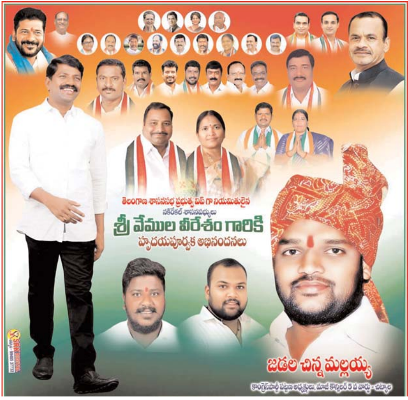
జిడల్ చిన్న మల్లయ్య