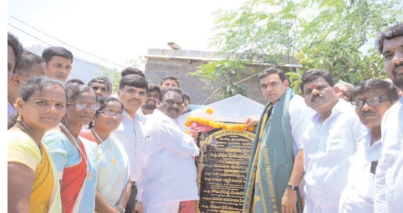
తుంగతుర్తి నియోజకవర్గం అన్వేషణ ప్రతినిధి