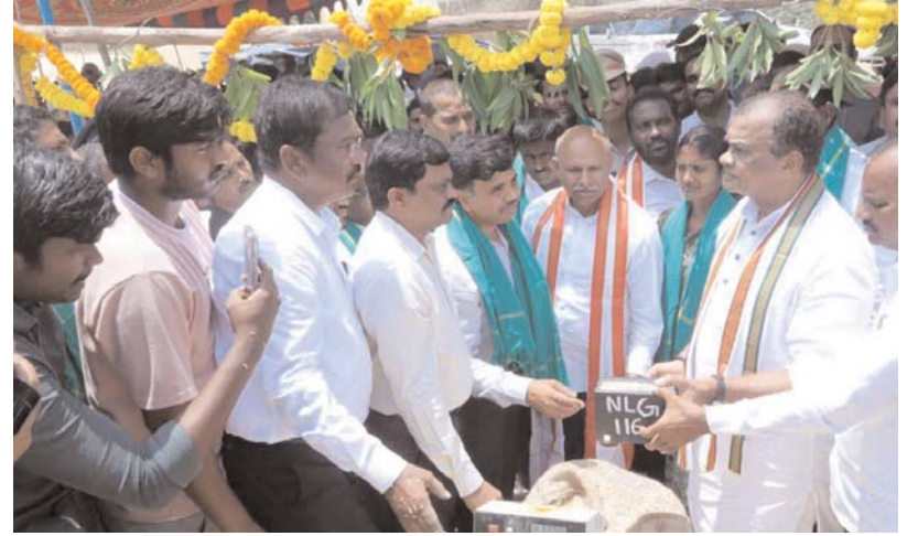
నల్లగొండ నియోజకవర్గం - అన్నేషనేత్రం ప్రతినిధి

నల్లగొండ మండలంలోని జి.చెన్నారం గ్రామంలో డిసిఎంఎస్ ఆధ్వర్యంలో ఏర్పాటు చేసిన ధాన్యం కొనుగోలు కేంద్రాన్ని రాష్ట్ర రోడ్డు, భవనాలు మరియు సినిమాటోగ్రఫీ శాఖ మంత్రి గౌరవనీయులు శ్రీ కోమటిరెడ్డి వెంకట్ రెడ్డి గారు ప్రారంభించారు. రైతులు పండించిన ధాన్యానికి సరైన మద్దతు ధర అందించడంతో పాటు, మధ్యవర్తుల సమస్యలు లేకుండా నేరుగా కొనుగోలు చేసే విధానాన్ని కాంగ్రెస్ ప్రభుత్వం అమలు చేస్తోంది.. ఈ కొనుగోలు కేంద్రం ద్వారా రైతులకు సులభంగా, పొరదర్శకంగా సేవలు అందుబాటులోకి రానున్నాయి.. రైతు సంక్షేమమే లక్ష్యంగా కాంగ్రెస్ ప్రభుత్వం కట్టబడి రైతుల కోసం పనిచేస్తూ, వ్యవసాయ రంగాన్ని బలోపేతం చేయడానికి అవసరమైన అన్ని చర్యలను కాంగ్రెస్ ప్రభుత్వం