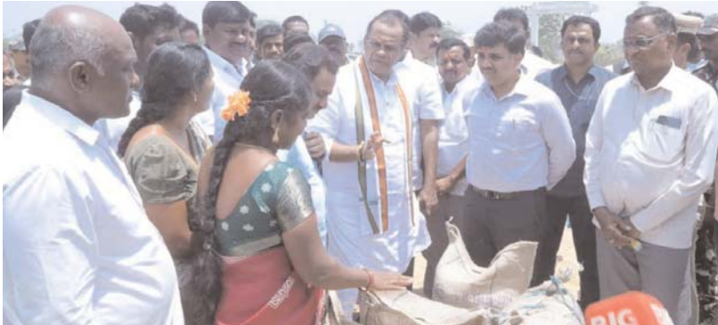
నల్లగొండ జిల్లా -