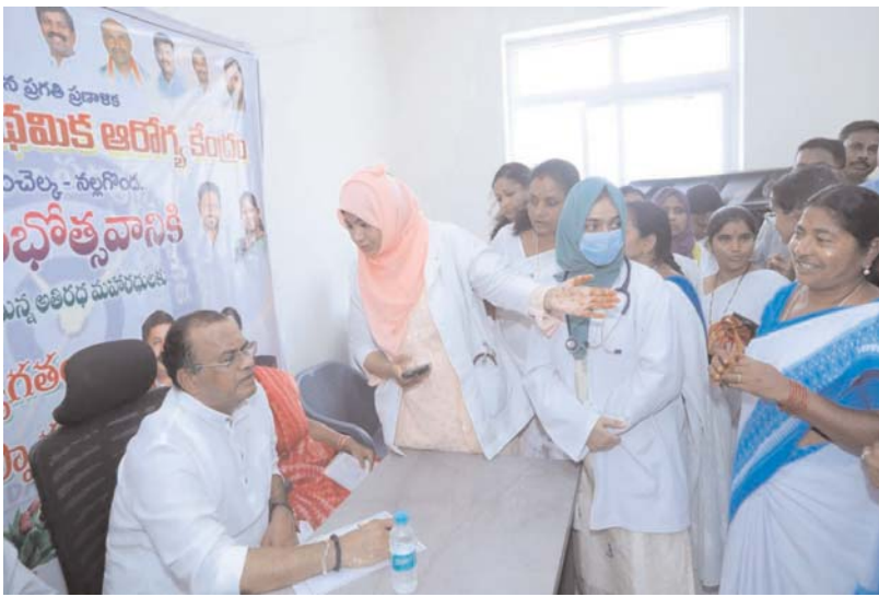
నల్లగొండ టౌన్ - అన్నేషనేత్రం ప్రతినిధి

ప్రజా పాలన-ప్రగతి ప్రణాళిక కార్యక్రమంలో భాగంగా నల్లగొండ జిల్లా మాన్యువల్లో పట్టణ ప్రాథమిక ఆరోగ్య కేంద్రాన్ని రాష్ట్ర రోడ్డు, భవనాలు మరియు సినిమాటోగ్రఫీ శాఖ మంత్రి గౌరవనీయులు శ్రీ కోమటిరెడ్డి వెంకట్ రెడ్డి గారు ప్రారంభించారు.. ప్రజలకు నాణ్యమైన, సమయానుకూల వైద్య సేవలు అందించాలనే ప్రభుత్వ సంకల్పానికి ఇది మరో ముందడుగు.. ఈ ఆరోగ్య కేంద్రం ద్వారా పట్టణ ప్రజలకు మెరుగైన వైద్య సదుపాయాలు అందుబాటులోకి రానున్నాయి.. ప్రతి కుటుంబానికి ఆరోగ్య భద్రత కల్పించడం లక్ష్యంగా కాంగ్రెస్ ప్రభుత్వం పని చేస్తున్నది అంతే కాకుండా నూతనంగా నల్లగొండ రోడ్డు రేషన్ షాపు బట్టి తెచ్చుకోవడం ఎంతో సుభవరమాణం ఈ కార్యక్రమంలో విశాలామైన రోడ్డు ద్రవ్యోజ్ఞ వ్యవస్థ ను పటిష్టంచేసి అన్ని వర్గాల అన్ని మతాల ప్రజలకు ఎలాంటి ఇబ్బందులు కలుగకుండా చూసుకునే బాధ్యత నాది మీకు అందుబాటులో కార్పొరేషన్ చేర్చిన బురి చైతన్య రెడ్డి ఇంకా కొంతమంది నాయకులు అందుబాటులో ఉంటారు .