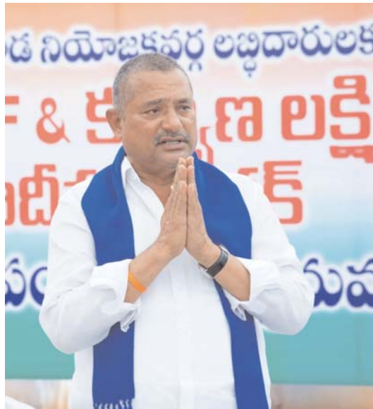
అతిరథ మహోద్యమకు స్వాగతం సుస్వాగతం