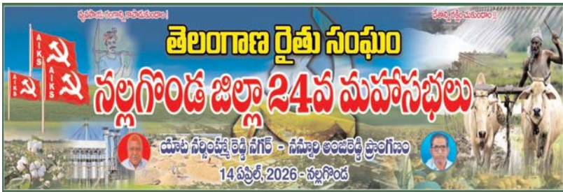
సల్లగొండ, అన్నవరేణి, ఏప్రిల్ 13: