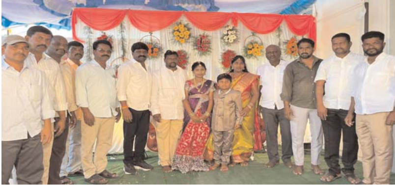
సకిరేకల్ నియోజకవర్గం :-