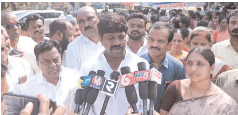
సకిరేకల్ పట్టణం :-అన్వేషనేత్రం ప్రతినిధి