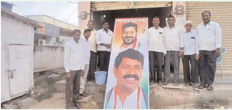
చిట్టాల:జనసేన ప్రతినిధి,మే 15: