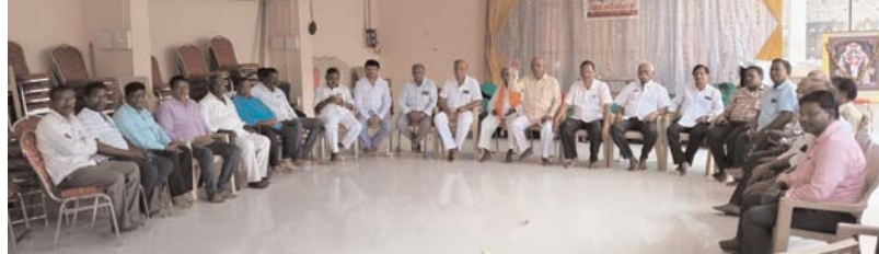
సూర్యాపేట జిల్లా న్యూస్ మే: 15 (అన్వేషణ):