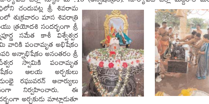
మాన శివరాత్రి సందర్భంగా కాశీ విశ్వేశ్వర స్వామికి అన్నాభిషేకం