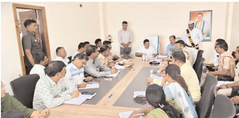
నల్లగొండ, అన్వేషణ కేంద్రం, మే 15 :