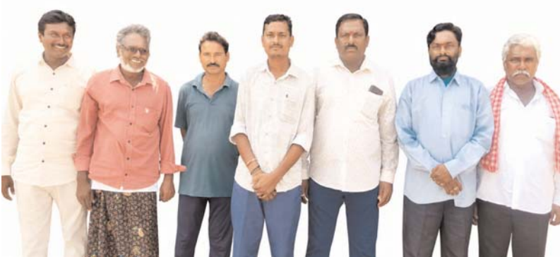
నేరేడుచర్ల, మే 15 అన్వేషణ కేంద్రం