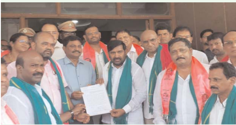
నల్లగొండ, అన్వేషణేత్రం, మే 18 :

ప్రభుత్వంపై బీఆర్ఎస్ నేతల విమర్శలు వెల్లువ