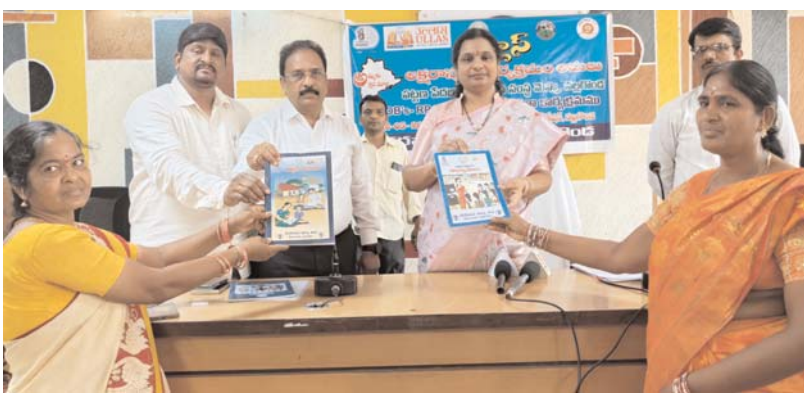
నల్లగొండ, అన్నేషనేత్రం, మే 18 :