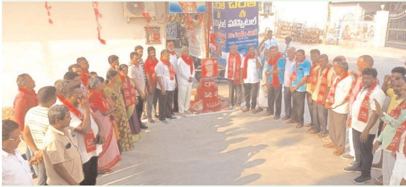
నల్లగొండ, అన్నేషనేత్రం, మే 19 :