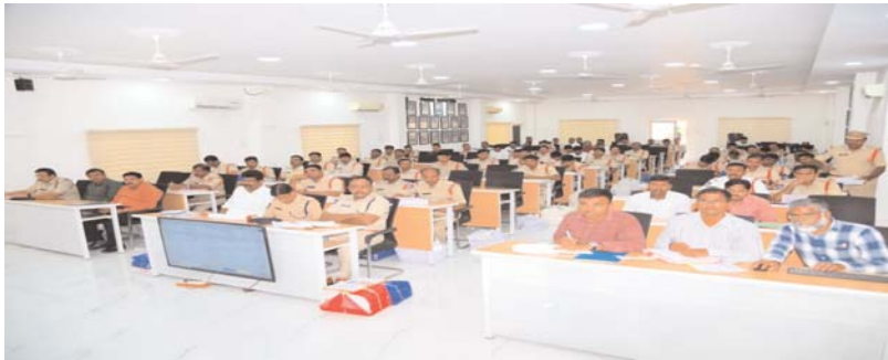
నల్లగొండ, అన్నేషనేత్రం, మే 19 :