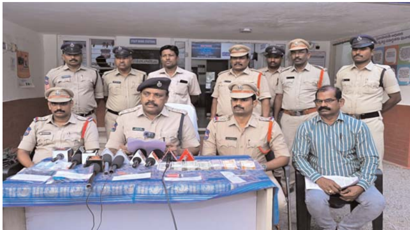
నల్లగొండ, అన్వేషణ, మే 23 :

24 గంటల్లోనే ఇద్దరి అరెస్ట్.. రూ.2.20 లక్షల నగదు స్వాధీనం.. డీఎస్పీ శివరాం రెడ్డి