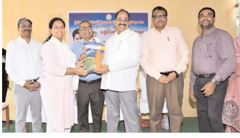
వ్యవసాయ పరిశోధన విభాగం వారు 2026 ప్రారంభించిన మంత్రి తుమ్మల