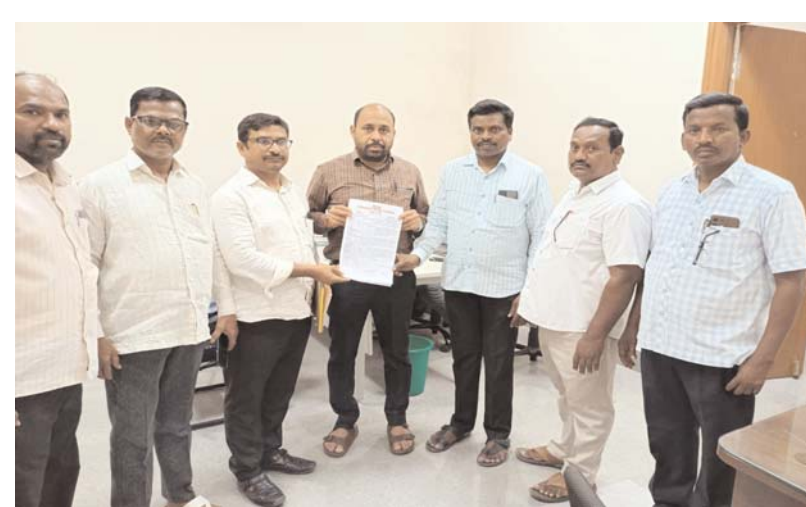
సూర్యాపేట జిల్లా స్టూన్ మే :23 (అన్వేషణ):