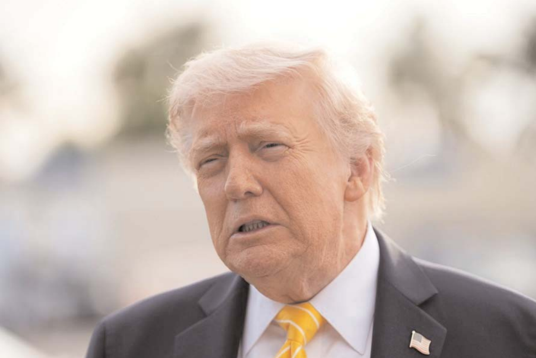
వెంపర్లాడం లేదని ఇరాన్ అధ్యక్షుడు పెజిషియాన్ ఇటీవల ఎలా స్పందిస్తుందో చూడాలి. వ్యాఖ్యానించారు. తాజాగా, ట్రంప్ వ్యాఖ్యల నేపథ్యంలో ఇరాన్

అమెరికా-ఇరాన్ మధ్య జరుగుతున్న శాంతి చర్చల్లో అణు కార్యక్రమం కీలకంగా మారింది. శుద్ధి చేసిన యురేనియంను వదులుకోవాలని అమెరికా కోరుతుండగా, అందుకు ఇరాన్ పూర్తిగా అంగీకరించడం లేదు. తాజాగా ఇరాన్ అణు కార్యక్రమంపై అమెరికా అధ్యక్షుడు డొనాల్డ్ ట్రంప్ కీలక వ్యాఖ్యలు చేశారు. ఇరాన్ వద్ద ఉన్న అధికంగా శుద్ధి చేసిన యురేనియంను అమెరికాకు అప్పగించాలని, లేదంటే అంతర్జాతీయ పర్యవేక్షణలో పూర్తిగా ధ్వంసం చేయాలని ట్రంప్ స్పష్టం చేశారు. ఇరాన్ అణు కార్యక్రమం ప్రపంచ దేశాలకు ముప్పుగా మారే అవకాశముందని ట్రంప్ హెచ్చరించారు. అధిక శుద్ధి చేసిన యురేనియం ద్వారా అణ్వాయుధాల తయారీ సాధ్యమవుతుందని, అందుకే దీనిపై కఠిన చర్యలు అవసరమని పేర్కొన్నారు. అమెరికా జాతీయ భద్రతను కాపాడేందుకు అవసరమైతే మరింత కఠిన నిర్ణయాలు తీసుకుంటామని కూడా చెప్పారు. కాగా, తమ వద్ద ఉన్న శుద్ధి చేసిన యురేనియంను వదులుకోవడానికి ఇరాన్ అంగీకరించినట్లు వార్తలు వస్తున్నాయి. తాము అణ్వాయుధం కోసం