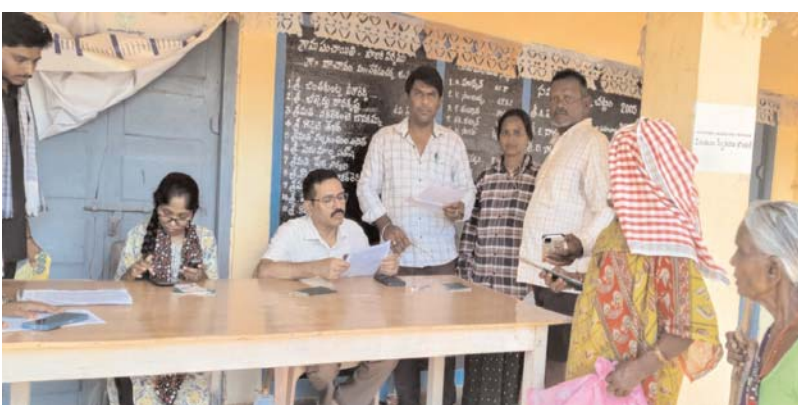
నేరేడుచర్ల-మే 26 అన్నపూర్ణ ప్రతినిధి