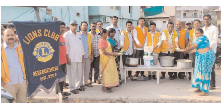
నేరేడుచర్ల-మే 26 అన్నపూర్ణ ప్రతినిధి