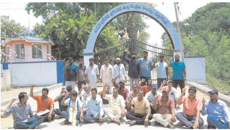
నల్లగొండ, అన్నపూర్ణ ప్రతినిధి, మే 26:

అర్జిట్యుఎస్--మిషన్ భగీరథ కాంట్రాక్టు కార్మికుల ఆవేదన