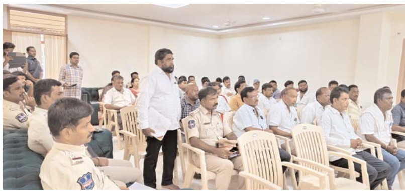
దేవరకొండ/నల్లగొండ, అన్నపూర్ణ ప్రతినిధి, మే 26: