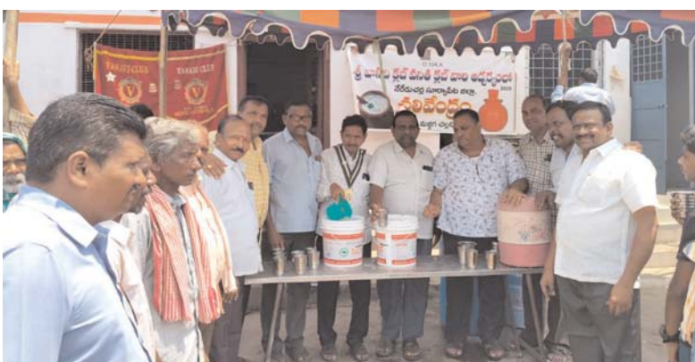
నేరేడుచర్ల-మే 26 అన్నపూర్ణ ప్రతినిధి