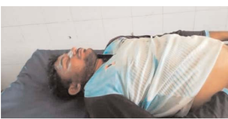
పాలక వీడు-మే 26 అన్నపూర్ణ ప్రతినిధి