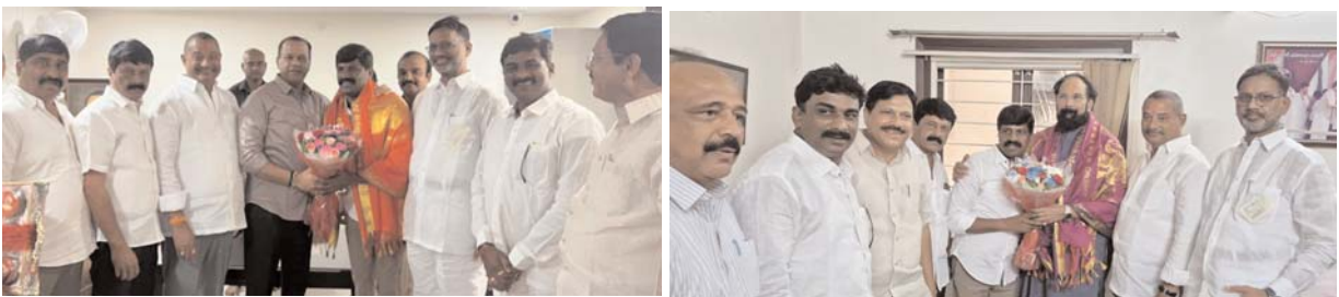
హైదరాబాద్ :- అన్వేషనలో ప్రతినిధి ఉండాలని ఆకాంక్షించారు.