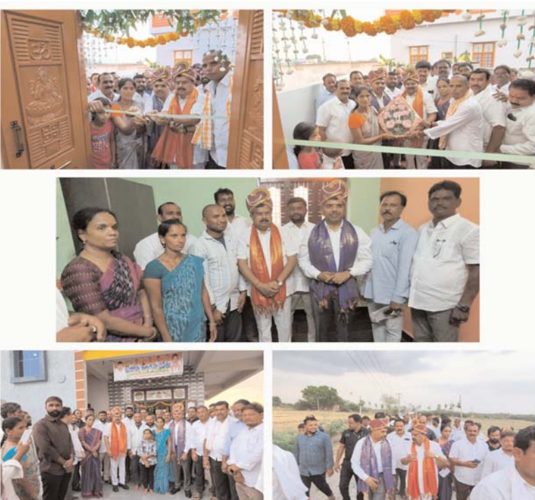
దేవరకొండ/ సల్లగొండ,జూన్ 1( అన్వేషనేత్రం ప్రతినిధి )

కలెక్టర్ తో కలిసి గృహప్రవేశాల్లో పాల్గొన్న దేవరకొండ ఎమ్మెల్యే బాలునాయక్