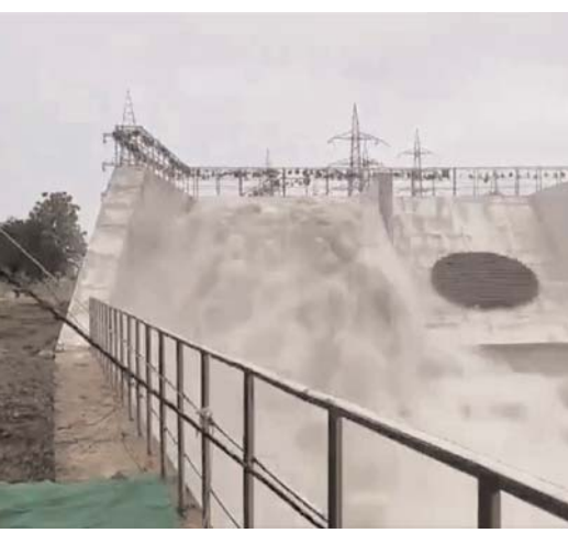
ఉమ్మడి ఖమ్మం జిల్లా నీటిపారుదల ప్రాజెక్టుల పూర్తి కోసం ప్రత్యేక కార్యచరణ రూపొందించనున్నట్లు తెలిపారు. సీతమ్మసాగర్ సహా అన్ని ప్రాజెక్టులను వేగవంతంగా పూర్తి

చేస్తామని వెల్లడించారు. ఖమ్మం జిల్లాలో ప్రతి ఎకరాకు సాగునీరు అందించడమే ప్రభుత్వ లక్ష్యమని వెల్లడించారు. భూసేకరణ, అటవీ అనుమతులు, నిర్మల సమస్యలను యుద్ధ ప్రాతిపదికన పరిష్కరిస్తామని చెప్పారు. సీతారామ ప్రాజెక్టు