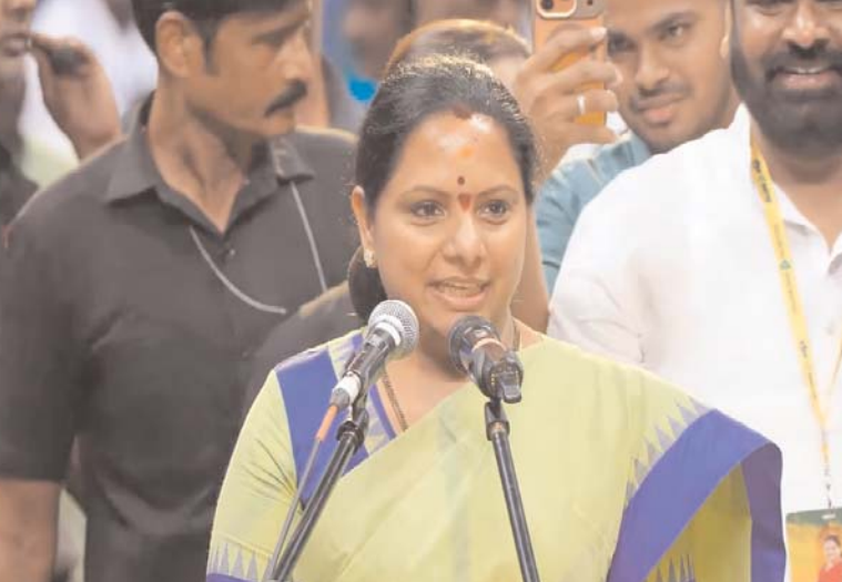
మరికొన్ని రాజకీయ పార్టీలు కూడా అభ్యంతరం వ్యక్తం చేస్తున్నాయి. తెలంగాణ రాజ్య సమితి' పేరుతో సమావేశం మరో రాజకీయ పార్టీ కూడా 'సూ' పేరును ఉపయోగించడాన్ని వ్యతిరేకిస్తూ ఎన్నికల సంఘాన్ని ఆశ్రయించింది. ఈ వివాదంపై వివరణ ఇచ్చేందుకు కవిత ప్రతినిధుల బృందం కూడా ఎన్నికల సంఘాన్ని కలిసొందుకు నిర్ణయమవుతున్నట్లు సమాచారం. భారీ సంఖ్యలో అభ్యంతరాలు వ్యక్తమవుతుండటంతో కవిత కొత్త రాజకీయ పార్టీకి 'బీఆర్ఎస్' పేరు దక్కుతుందా లేదా అన్నది ఇప్పుడు రాజకీయ వర్గాల్లో హాట్ టాపిక్ గా మారింది.

ఇప్పటికే తీవ్ర అంతర్గత విభేదాలతో ఇబ్బందులు ఎదుర్కొంటున్న తృణమూల్ కాంగ్రెస్ (పవీజ)లో కీలక పరిణామాలు చోటుచేసుకుంటున్నాయి. టీఎంసీ సీనియర్ నేత, ఎంపీ కల్యాణ్ బెనర్జీ పార్టీ అధినేత మమతా బెనర్జీకి నేరుగా అల్లిమేటం జారీ చేశారు. మమత మేనల్లుడు, టీఎంసీ కీలక నేత అభిషేక్ తో తాజాగా తృణమూల్ ఎంపీ కల్యాణ్ బెనర్జీ తీవ్ర విమర్శలు చేశారు. నేను మమత దీని వెంటే ఉన్నాను. కానీ, ఆమె ఎవరి వక్త్రం ఉన్నారో తెల్పుకోవాలి. మమత మాతో ఉంటారా.. లేక అభిషేక్ తో ఉంటారా' అని కల్యాణ్ ప్రశ్నించారు. సంకలన ఫోర్టర్ల కేసులో చివరి నిమిషంలో తనను న్యాయవాదిగా తొలగించి అభిషేక్ అవమానించారని కల్యాణ్ ఆవేదన వ్యక్తం చేశారు. అభిషేక్ కు సీనియర్ లీడర్లను గౌరవించడం రాదని, అహంకారంతో తనను తాను కింగ్ గా భావించుకోవడం వల్లే పార్టీ ధ్వంసమవుతోందని కల్యాణ్ పేర్కొన్నారు. ఇటీవల ఆసెంబ్లీ ఎన్నికల్లో పరాజయంతో టీఎంసీకి కష్టాలు మొదలయ్యాయి. పలువురు ఎమ్మెల్యేలు, ఎంపీలు పార్టీని వీడి వెళ్లిపోయారు. ముఖ్యంగా మమత మేనల్లుడు అభిషేక్ బెనర్జీపై చాలా కాలంగా ఉన్న అసంతృప్తిని పార్టీ నేతలు బహిరంగంగా వెళ్లగక్కుతున్నారు. తాజాగా, టీఎంసీ రాజ్యసభ ఎంపీ ప్రకాష్ బైరెక్ కూడా రాజీనామా చేశారు. వారం రోజుల వ్యవధిలో రాజ్యసభకు రాజీనామా చేసిన మూడో టీఎంసీ ఎంపీగా ప్రకాష్ బైరెక్ నిలిచారు. దీంతో ఎగువ సభలో తృణమూల్ ఎంపీల బలం పడికి తగ్గింది.