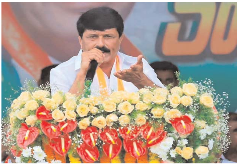
తెలంగాణ ఉద్యమ కారుడు, కాంగ్రెస్ పార్టీ సీనియర్ రాష్ట్ర నాయకులు గౌరవ శ్రీ దుబ్బాక నర్సింహారెడ్డి అన్న గారికి హృదయపూర్వక జన్మదిన శుభాకాంక్షలు తెలుపుతూ మంచి ఆలోచనలతో ఆయనకు అన్న కుటుంబానికి ఇవ్వాలని ఆ యేసుక్రీస్తు ప్రభును కోరుకుంటూ ప్రార్థన చేస్తున్నా ఆమెన్