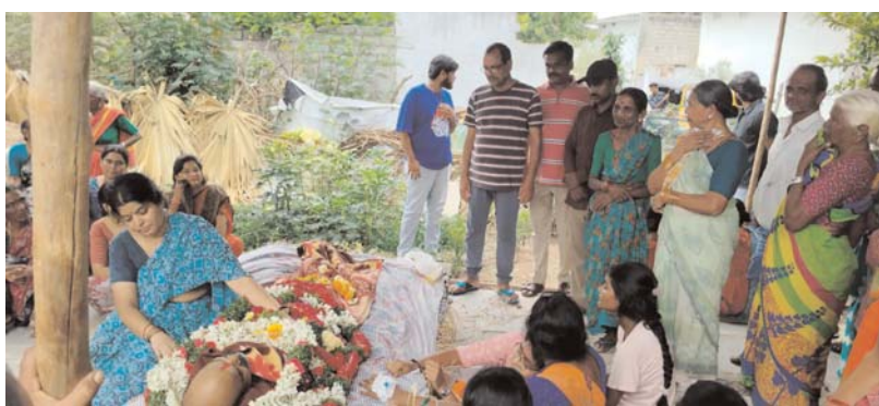
నల్లగొండ, జూన్ 12 (అన్వేషనేత్రం ప్రతినిధి) :

టీయూడబ్ల్యూజే (ఐజేయూ) జిల్లా కమిటీ తరపున సంతాపం