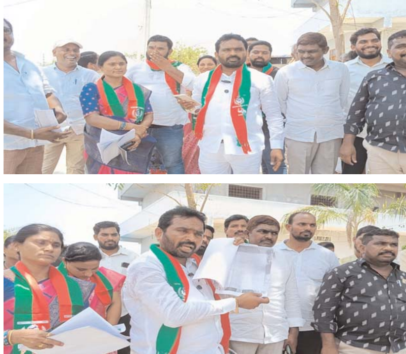
సూర్యాపేట జిల్లా సూన్ జూన్: 19 (అన్నేషనేత్రం) :