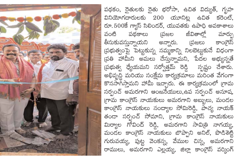
ద్వారా గౌరవప్రదమైన జీవనం