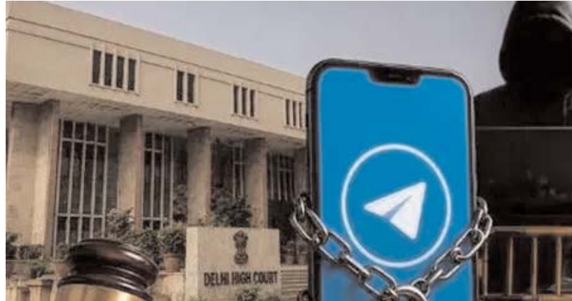
న్యూఢిల్లీ, అన్వేషణ ప్రతినిధి

నీట్ పరీక్ష నేపథ్యంలో కేంద్ర ప్రభుత్వం టెలిగ్రామ్ పై తాత్కాలిక నిషేధం విధించడాన్ని ఢిల్లీ హైకోర్టు సమర్థించింది. కేంద్ర ప్రభుత్వ నిర్ణయాన్ని సవాల్ చేస్తూ టెలిగ్రామ్ దాఖలు చేసిన పిటిషన్ ను కొట్టివేసింది. కేంద్ర ప్రభుత్వ నిర్ణయం సరైనదేనని జస్టిస్ తేజస్ కారియా తేల్చి చెప్పారు. కేంద్రం తరఫున సాలిసిటర్ జనరల్ తుషార్ మెహతా వాదనలు వినిపించారు. అక్రమ, చట్టవిరుద్ధ కార్యకలాపాలకు పాల్పడేవారికి టెలిగ్రామ్ ప్రధాన సాధనంగా మారినందున అన్నారు. అనుమానాస్పద ఛానల్స్ పై చర్యలు తీసుకోవాలని గతంలో పలుమార్లు టెలిగ్రామ్ కు సూచించామని అన్నారు. అయినప్పటికీ కంపెనీ తగిన చర్యలు తీసుకోవడంలో విఫలమైందని చెప్పారు. మరోవైపు, టెలిగ్రామ్ తరఫున సీనియర్ న్యాయవాది ప్రభు మెహతా వాదనలు వినిపిస్తూ ఎమ్మెల్యే అధికారంలో నిషేధం విధించడాన్ని కేంద్రం సమర్థించుకోవాలని అన్నారు. సంబంధిత కంటెంట్ ను మాత్రమే బ్లాక్ చేయకుండా మొత్తం యాక్స్ పై ఎందుకు నిషేధం విధించాల్సి వచ్చిందో వివరించలేదని పేర్కొన్నారు. కేవలం నీట్ పరీక్షలో దేశ వార్యులను తప్పించి, సమగ్రతకు ముప్పు ఏర్పడుతుందా? అని ప్రశ్నించారు. అయితే, కోర్టు కేంద్రం వాదనలను సమర్థించింది. సెక్షన్ 69ఏ కింద ఒక డిజిటల్ వేదికను నిషేధించే అధికారం ప్రభుత్వానికి ఉందని జస్టిస్ తేజస్ కారియా స్పష్టం చేశారు. నిషేధం ఎత్తివేత కోరుతూ టెలిగ్రామ్ చేసిన అభ్యర్థనను తిరస్కరించారు. జూన్ 22 వరకూ కేంద్రం టెలిగ్రామ్ పై నిషేధం విధించిన విషయం తెలిసింది.