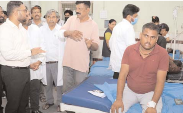
సూర్యాపేట జిల్లా స్టూన్ జూస్: 19 (అన్వేషణ):