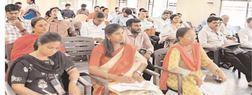
సల్లగొండ, జూన్ 19 (అన్వేషణ ప్రతినిధి) :

రెండో విడత ఇందిరమ్మ ఇళ్ల మంజూరు ప్రక్రియను పూర్తిస్థాయి పారదర్శకతతో నిర్వహించాలని దేవరకొండ ఎమ్మెల్యే నేనావత్ బాలు నాయక్ అధికారులను ఆదేశించారు. ఇందిరమ్మ ఇళ్ల అవలు, అర్హత ఎంపిక, ప్రభుత్వ మార్గదర్శకాలపై గృహనిర్మాణ శాఖ అధికారులు, మండల అభివృద్ధి అధికారులతో నిర్వహించిన సమీక్ష సమావేశంలో ఆయన పాల్గొన్నారు. ఈ సందర్భంగా ఎమ్మెల్యే మాట్లాడుతూ, నియోజకవర్గ పరిధిలో 226 గుడిసెలను అధికారులు గుర్తించారని తెలిపారు. ప్రభుత్వ నిబంధనలకు అనుగుణంగా ఆ కుటుంబాలన్నింటికీ ఇందిరమ్మ ఇళ్ల మంజూరు చేసేలా చర్యలు చేపట్టాలని సూచించారు. సోదా లేకుండా గోడలతోనే నిలిచిపోయిన అసంపూర్ణ ఇళ్లకు పైకప్పు నిర్మాణం కోసం ప్రభుత్వం రూ.2 లక్షల ఆర్థిక సహాయం అందిస్తున్న విషయాన్ని ప్రజల్లో విస్తృతంగా ప్రచారం చేయాలని అధికారులకు సూచించారు. ప్రభుత్వ ఉద్యోగులు ఇందిరమ్మ ఇళ్ల పథకానికి అనర్హులని ప్రభుత్వం స్పష్టంచేసిన సేవధ్యంలో, లబ్ధిదారుల అర్హతల పరిశీలనను కచ్చితంగా నిర్వహించాలని అన్నారు. తొలి విడతలో ఎక్కడైనా సాంకేతిక లోపాలు లేదా అవకతవకలు చోటుచేసుకుని ఉంటే, రెండో విడతలో అలాంటి పరిస్థితులు తలెత్తకుండా ప్రత్యేక శ్రద్ధ తీసుకోవాలని అధికారులను ఆదేశించారు. "అర్హతైన ప్రతి పేద కుటుంబానికి ఇందిరమ్మ ఇల్లు అందాలి. దేవరకొండ నియోజకవర్గంలో సొంత ఇల్లు లేని పేద కుటుంబం ఒక్కటి మిగలకూడదు. ప్రభుత్వ మార్గదర్శకాలకు అనుగుణంగా ఎంపికలు పూర్తిస్థాయి పారదర్శకతతో జరగాలి" అని బాలు నాయక్ స్పష్టం చేశారు. పేదల సొంతింటి కలను సాకారం చేయడమే రాష్ట్ర ప్రభుత్వ లక్ష్యమని పేర్కొన్న ఆయన, అర్హతైన లబ్ధిదారులకు న్యాయం జరిగేలా అధికారులు బాధ్యతాయుతంగా వ్యవహరించాలని సూచించారు. సమావేశంలో గృహనిర్మాణ శాఖ అధికారులు, మండల అభివృద్ధి అధికారులు, ఇతర శాఖల అధికారులు పాల్గొన్నారు.