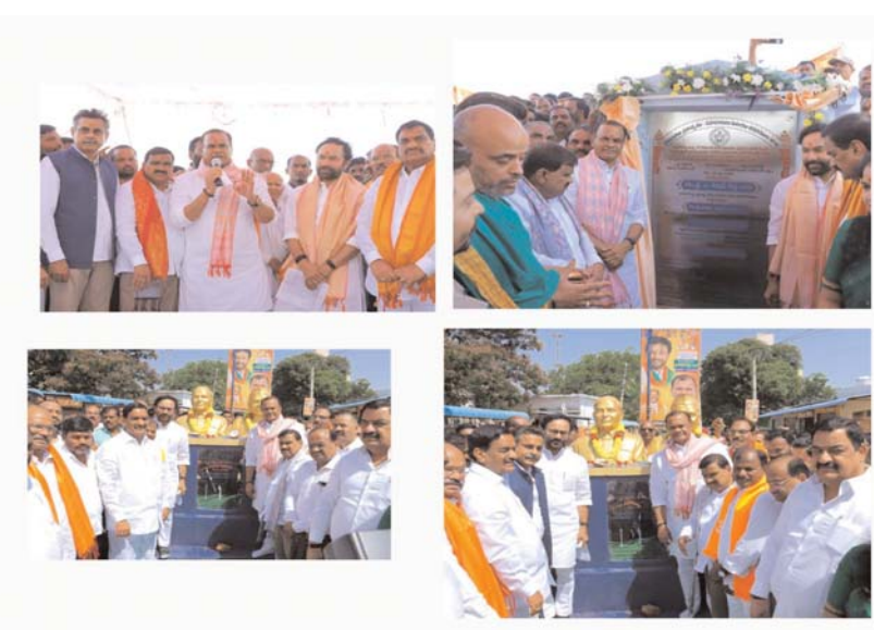
సల్లగొండ, జూన్ 19 ( అన్వేషణ ప్రతినిధి ):

కేంద్ర బోగ్గ, గనుల శాఖ మంత్రి జి . కిషన్ రెడ్డి , రాష్ట్ర రోడ్డు--భవనాలు, సినిమాలోగ్రఫీ శాఖ మంత్రి కోమలిరెడ్డి వెంకట్ రెడ్డి కలిసి రంగారెడ్డి జిల్లాలో రూ.55 కోట్ల వ్యయంతో చేపట్టనున్న రెండు ప్రధాన రహదారి అభివృద్ధి పనులకు శంకుస్థాపన చేశారు. లేమూర్ గ్రామంలో రూ.38 కోట్లతో నిర్మించనున్న 14 కిలోమీటర్ల ద్వీపార్ధ రహదారి పనులను ప్రారంభించారు. ఈ రహదారి లేమూర్--శ్రీశైలం హైవే --తిమ్మాపూర్ మార్గాన్ని అగర్మియోగూడ మీదుగా అనుసంధానించనుంది. దీంతో పరిసర గ్రామాల ప్రజలకు రాకపోకలు సులభతరం కానున్నాయి. అనంతరం బేగంపేట్ గ్రామంలో రూ.17 కోట్ల అంచనా వ్యయంతో చేపట్టనున్న 6.2 కిలోమీటర్ల ద్వీపార్ధ రహదారి విస్తరణ పనులకు శంకుస్థాపన చేశారు. బేగంపేట--ఎలిమినేరు మార్గాపూర్ మార్గాన్ని ఆధునికీకరించడం ద్వారా రవాణా సౌకర్యాలు మెరుగుపడటంతో పాటు ప్రాంతీయ అభివృద్ధికి దోహదం చేయనుంది. ఈ సందర్భంగా మాట్లాడిన మంత్రులు, గ్రామీణ ప్రాంతాల్లో మౌలిక సదుపాయాల కల్పనకు ప్రభుత్వం ప్రాధాన్యం ఇస్తోందని, ఈ రహదారులు అందుబాటులోకి వస్తే ప్రజల ప్రయాణం మరింత సౌకర్యవంతంగా మారుతుందని తెలిపారు.