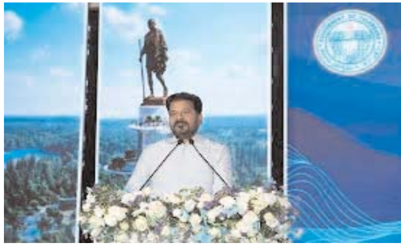
హైదరాబాద్, అన్వేషణ ప్రతినిధి

తెలంగాణ ప్రభుత్వం తలపెట్టిన మూసీ రివర్ ప్రాజెక్ట్ అభివృద్ధికి కీలక ముందడుగు పడింది. గాంధీ సరోవర్ ప్రాజెక్ట్ అనుబంధ కేంద్రం నుంచి అధికారిక అనుమతి లభించింది. మూసీ రివర్ ప్రాజెక్ట్ కేంద్ర రక్షణ మంత్రిత్వ శాఖ గ్రీన్ సిగ్నల్ ఇచ్చింది. భాషాభివృద్ధి 'గాంధీ సరోవర్'గా అభివృద్ధి చేయడానికి వర్సింగ్ పరిష్కారం మంజూరు చేసింది. రూ. 533.42 కోట్ల విలువైన 83.81 ఎకరాల డిఫెన్స్ భూమి వినియోగానికి అనుమతిచ్చింది. ఆర్టిలరీ సెంటర్ గోల్కొండ పరిధిలోని భూమిలో అభివృద్ధి పనులకు కేంద్రం క్లియరెన్స్ ఇచ్చింది.