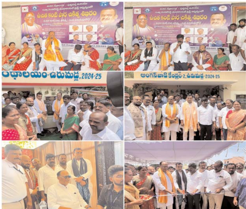
నల్లగొండ, జూన్ 20 ( అన్నేషనేత్రం ప్రతినిధి ) :