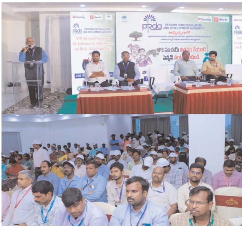
నల్లగొండ, జూన్ 20 ( అన్నపూర్ణ ప్రతినిధి ) :