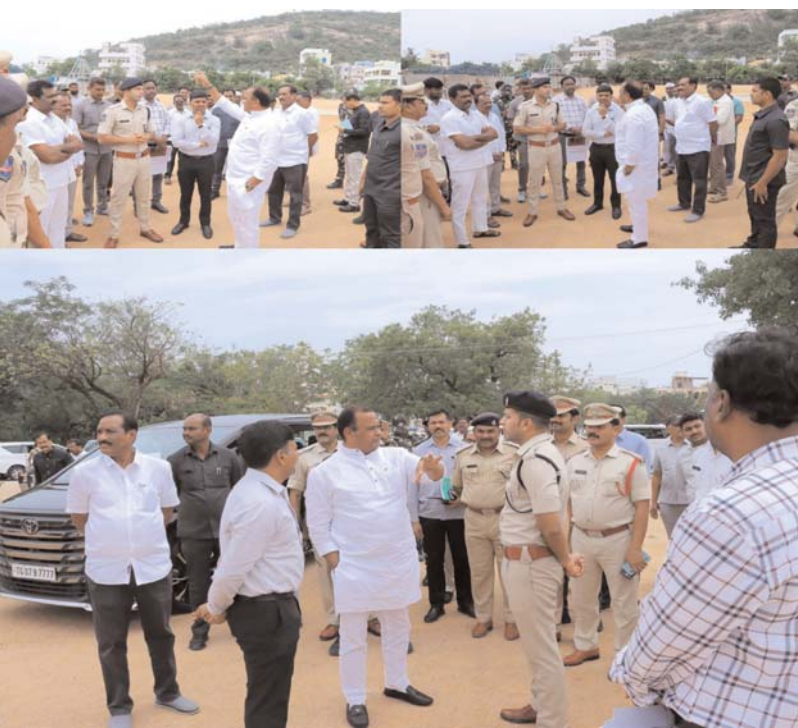
నల్లగొండ, జూన్ 20 ( అన్నేషనేత్రం ప్రతినిధి ) :

జిల్లా కేంద్రంలోని ఎస్సీ కళాశాల మైదానంలో త్వరలో నిర్వహించనున్న ముఖ్యమంత్రి బహిరంగ సభ ఏర్పాట్లను రాష్ట్ర రోడ్డు, భవనాలు, సినిమాటోగ్రఫీ శాఖ మంత్రి కోమటిరెడ్డి ఎవంట్ రెడ్డి పుకరంగా జిల్లా యంత్రాంగ అధికారులతో కలిసి పరిశీలించారు. సభా వేదిక, ప్రజల కూర్చునే ఏర్పాట్లు, వాహనాల పార్కింగ్, తాగునీరు, విద్యుత్, పారిశుధ్య సౌకర్యాలపై అధికారులతో సమీక్ష నిర్వహించారు. సభకు పెద్ద ఎత్తున ప్రజలు హాజరయ్యే అవకాశం ఉన్నందున ఎలాంటి ఇబ్బందులు తలెత్తకుండా ముందస్తు చర్యలు చేపట్టాలని అధికారులను ఆదేశించారు. భద్రతా ఏర్పాట్లతో పాటు ట్రాఫిక్ నియంత్రణపై ప్రత్యేక దృష్టి సారించాలని సూచించారు. సభ నిర్వహణకు సంబంధించిన పనులను నిర్ణీత గడువులోగా పూర్తి చేయాలని మంత్రి ఆదేశించారు.