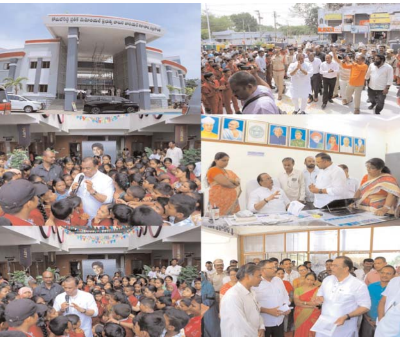
నల్లగొండ, జూన్ 20 ( అన్నేషనేత్రం ప్రతినిధి ) :

నల్లగొండ జిల్లా కేంద్రంలోని కోమటిరెడ్డి ప్రతీక రెడ్డి ప్రభుత్వ బాలుర జూనియర్ కళాశాల ౬ ఒకేషన్లో జూనియర్ కళాశాలను రాష్ట్ర రోడ్డు, భవనాలు, సినిమాటోగ్రఫీ శాఖ మంత్రి కోమటిరెడ్డి వెంకటరెడ్డి ఈరోజు సందర్శించారు. ఈ సందర్భంగా కళాశాలలో విద్యార్థుల సంఖ్యను పెంచడంతో పాటు నాణ్యమైన విద్యను అందించే దిశగా ప్రత్యేక చర్యలు చేపట్టాలని కళాశాల అధికారులను సూచించారు. విద్యార్థులకు మెరుగైన విద్యా అవకాశాలు కల్పించేందుకు అవసరమైన అన్ని చర్యలు తీసుకోవాలని అధికారులకు ఆదేశించారు. కళాశాలలో ఉన్న వివిధ సమస్యలను అధ్యాపకులు మంత్రి దృష్టికి తీసుకువెళ్లగా, వాటిని పరిశీలించి త్వరితగతిన పరిష్కరిస్తామని హామీ ఇచ్చారు. కళాశాల అభివృద్ధి, విద్యా ప్రమాణాల పెంపు కోసం ప్రభుత్వం కట్టుబడి ఉందని మంత్రి పేర్కొన్నారు.